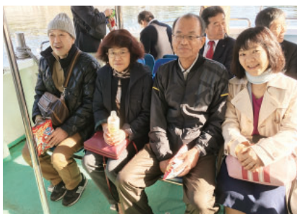
気仙沼内湾クルージング