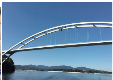
来春開通予定の大島大橋