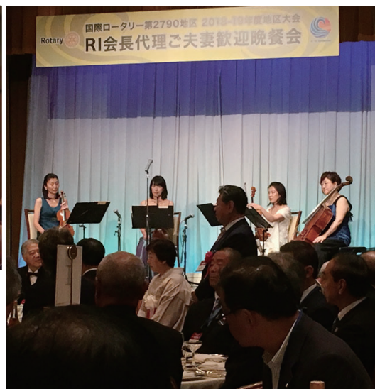
RI 会長代理ご夫妻歓迎晩餐会