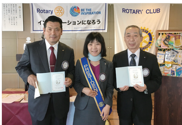
米山功労者 メジャードナー 大原会員・山口会員