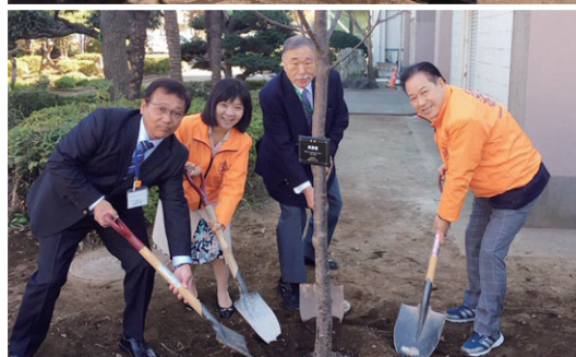
二宮小学校、桜植樹