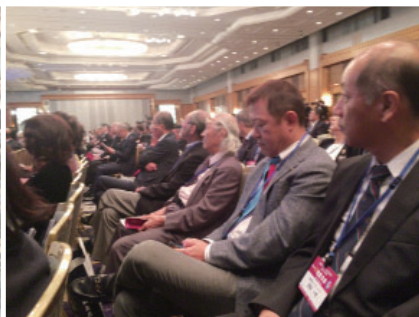
地区大会 参加会員