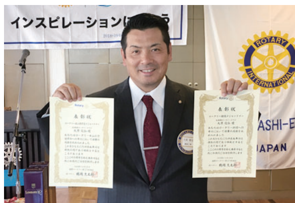
ロータリー米山奨学生メジャードナー・ ロータリー財団メジャードナー、大原会員