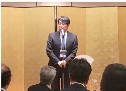
衆議院議員 前防衛大臣 小野寺 五典 様 乾杯