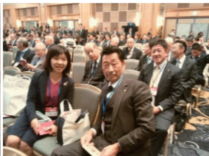
地区大会 クラブ会員