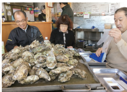
復興かき小屋 唐桑番屋での蒸し牡蠣食べ放題