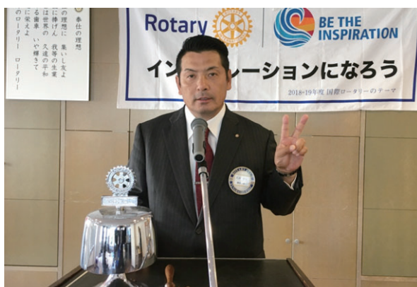
大原国際奉仕委員長 : ミャンマー支援事業の報告