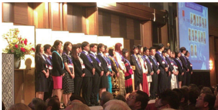
地区大会 参加青少年