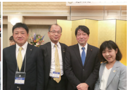
小野寺前防衛大臣との記念写真